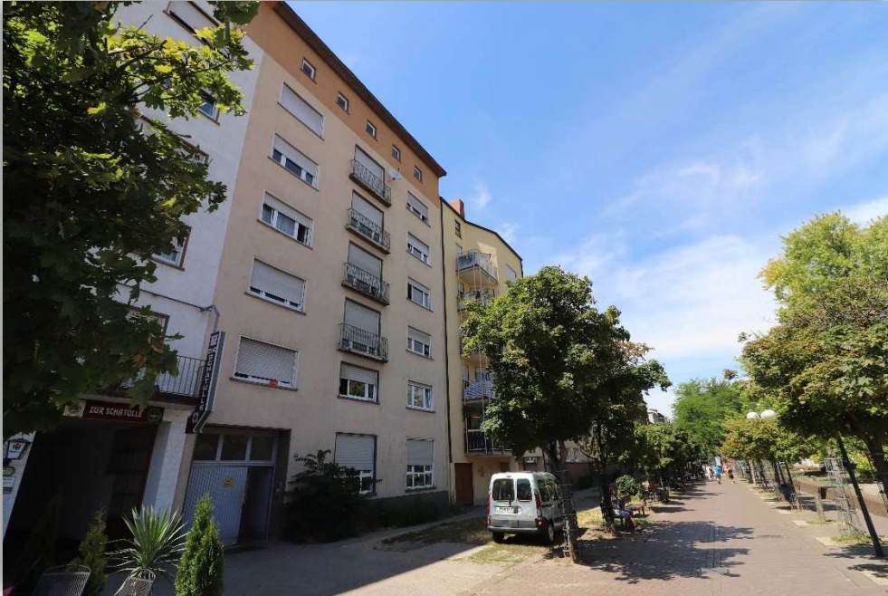
1: AUßENANSICHT - VORDERSEITE