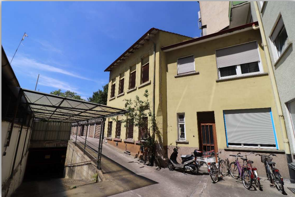
3: AUßENANSICHT – HOFSEITE, HINTERHAUS, TG ABFAHRT