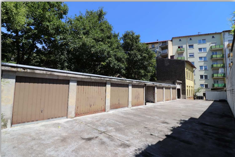
4: AUßENANSICHT – HOFSEITE, GARAGEN