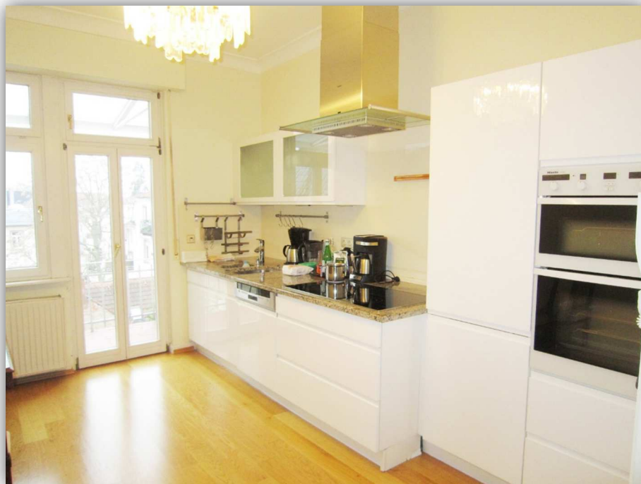
3: KÜCHE MIT BALKON